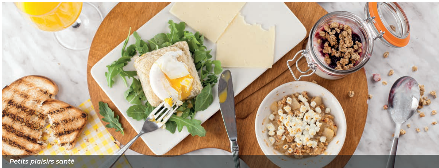
Petits plaisirs santé