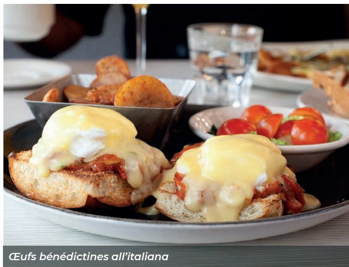
Œufs bénédictines all'italiana