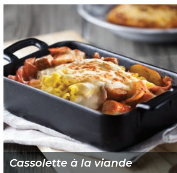
Cassiole à la viande