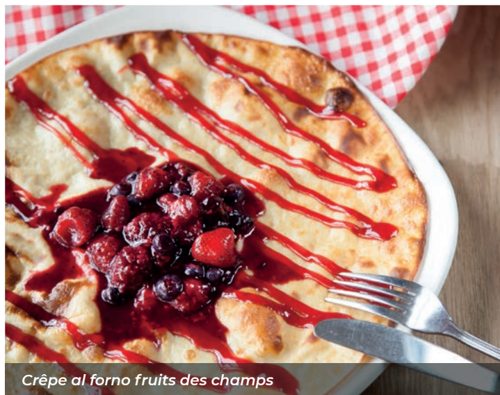
Crêpe al forno fruits des champs