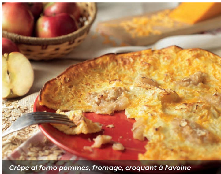
Crêpe al forno pommes, fromage, croquant à l'avoine