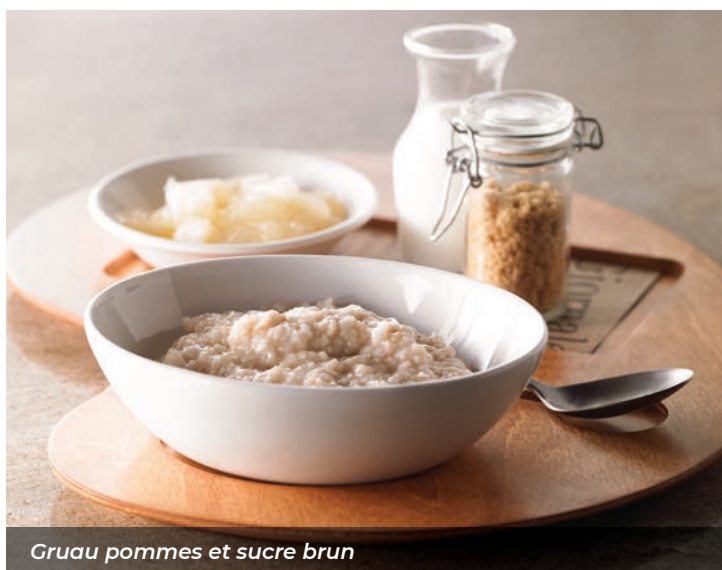
Gruau pommes et sucre brun