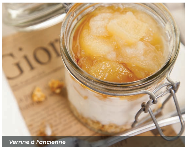
Verrine à l'ancienne