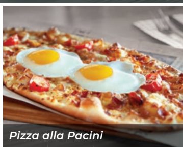
Pizza alla Pacini