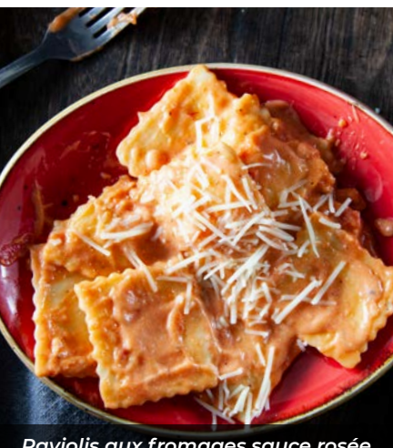
Raviolis aux fromages sauce rosée